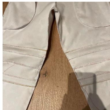
12, Sešijeme vnitřní nohavice.