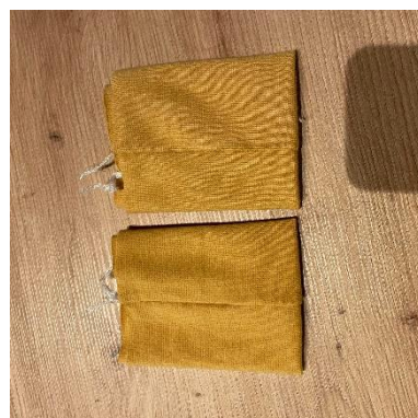
15, Náplety v půli přetočíme.