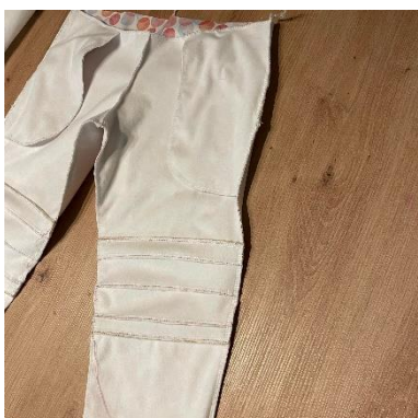
13, Sešijeme kalhoty na bocích.