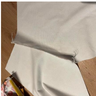
10, Zadní díly v sedu sešijeme.