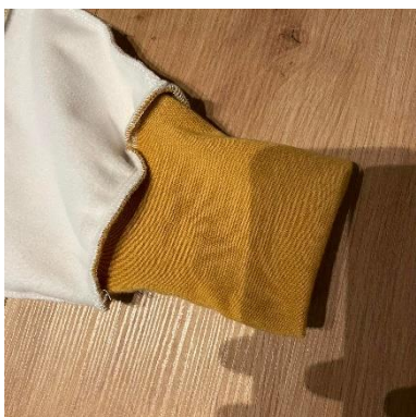
16, Náplety našijeme na nohavice.