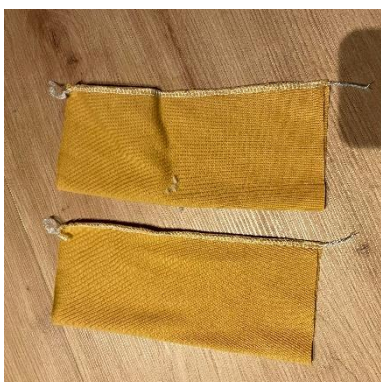
14, Náplety nohavic sešijeme na bocích.