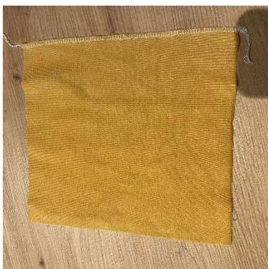
17, Náplet pasu na boku sešijeme.